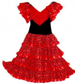
UNE ROBE DE FLAMENCO